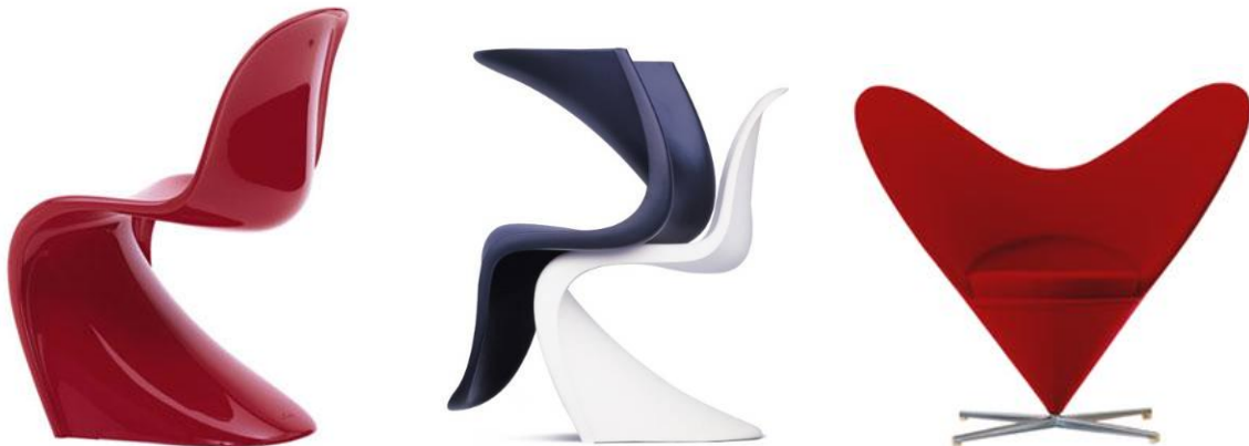
Panton Chair, 1958© Panton Design, Basel