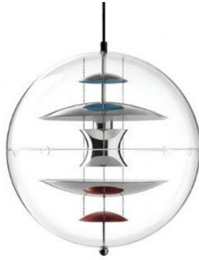
좌) Spiral Lampen“, Hanging lamp SP1. Serial production model in context of Visiona 2, Cologne 1970