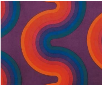
Furnishing fabric collection Domino Design Curve, 1975© Panton Design, Basel

‘칼라, 패턴, 그리고 시스템’ 부분에서는 팬톤의 텍스타일 디자인을 선보인다. 그와 미라 엑스(Mira-X)사의 오랜 기간에 걸친 합작으로 몇 가지 패턴과 컬러를 기본으로 한 역사적인 결과물은 다시 한 번 그의 체계적인 원리를 증명한다. 텍스타일 디자인에서 사용된 에나멜이나 종이와 같은 심미적인 요소는 인테리어 장식 재질로도 사용되었으며 팬톤의 전설적인 인테리어 프로젝트는 그의 전기적인 활동의 통합이자 클라이맥스로 간주 된다. 그의 주된 목적은 바닥, 벽, 그리고 천장 세 부분으로 나누어져 있는 전형적인 공간의 개념을 벗어나서 하나로 조화를 이루는 디자인이다. ‘판타지 룸’의 재구성은 관람객들에게 효과적으로 이를 설명할 것이다.